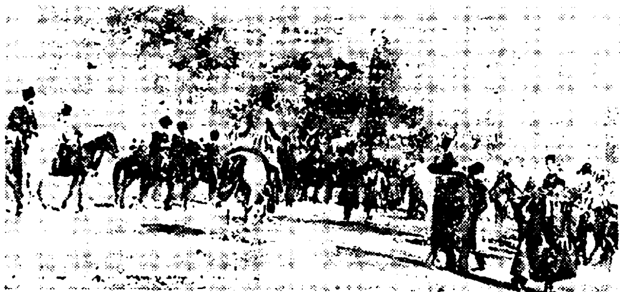
سرکوبی قیام تنباکو