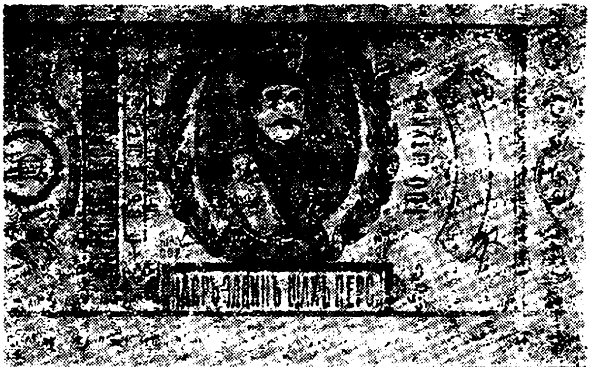
لفاف بسته‌های تنباکو