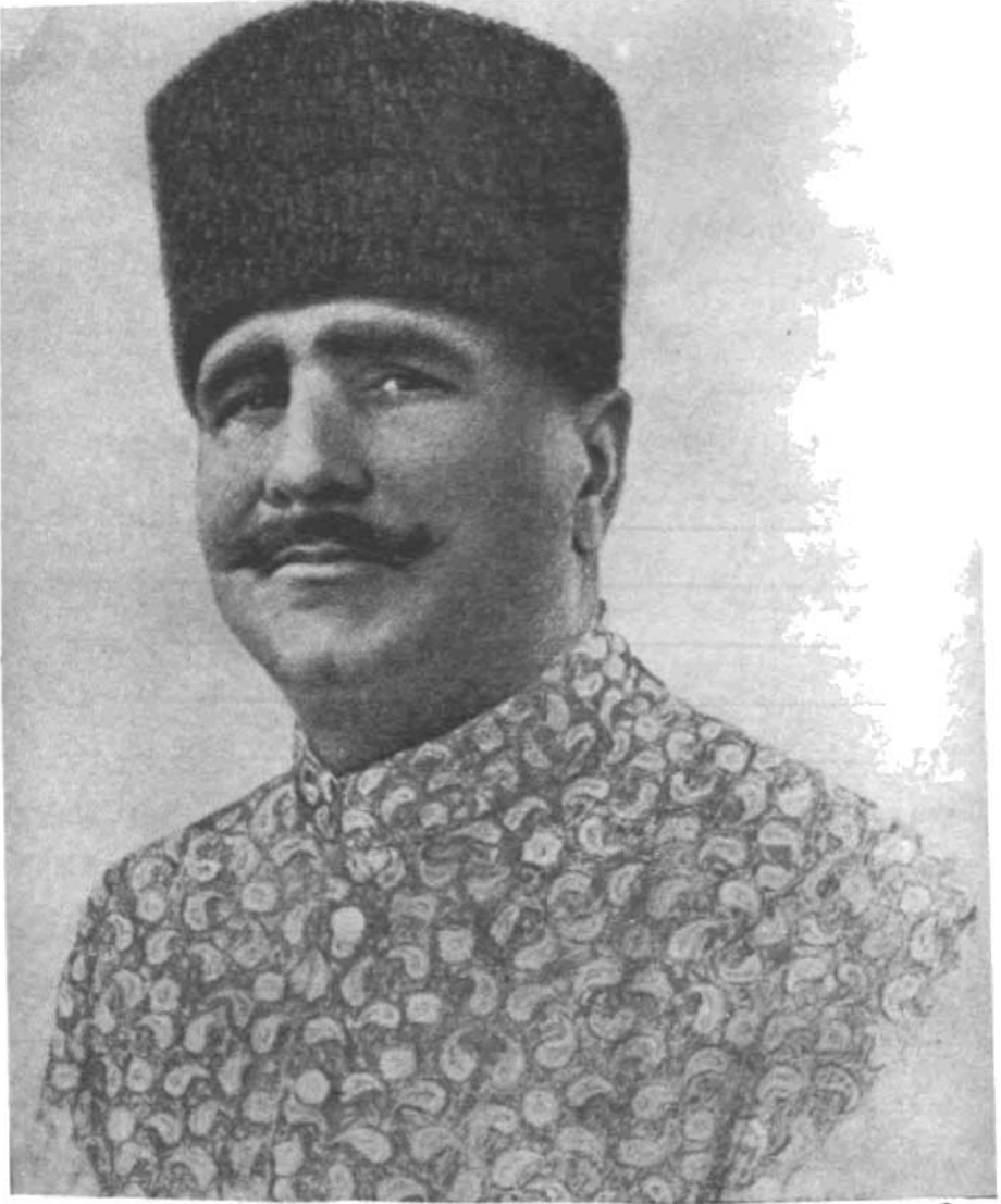
علامہ اقبال — شاعر پارسیگوی پاکستان